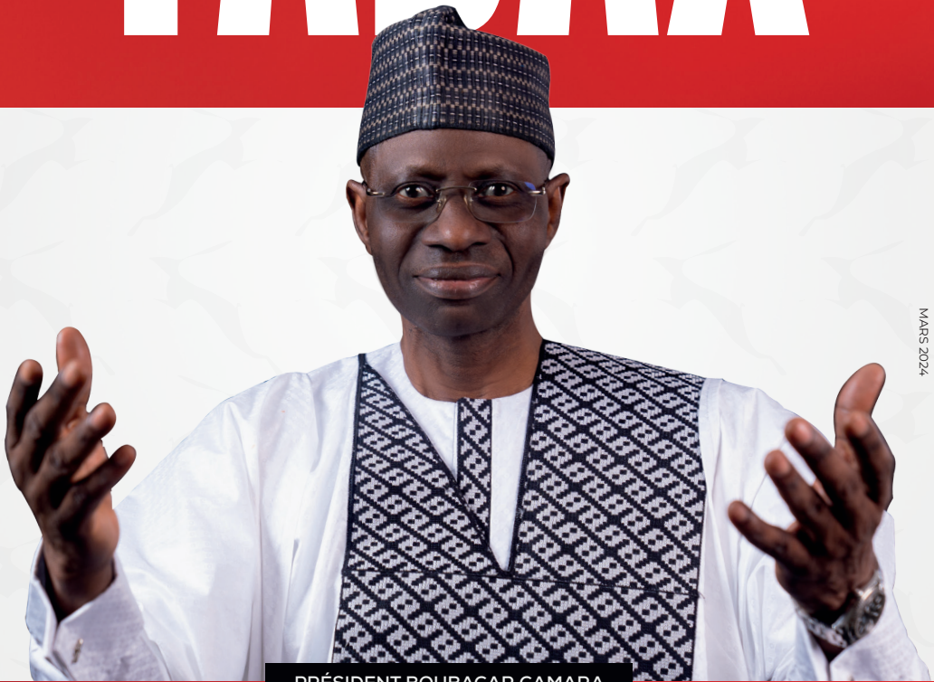
PRÉSIDENT BOUBACAR CAMARA